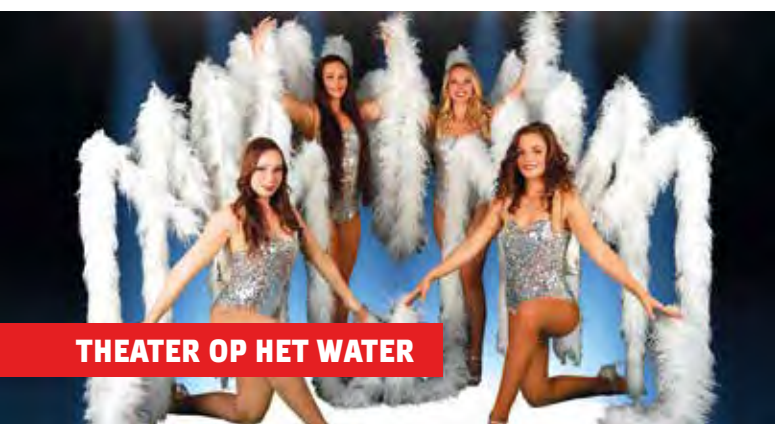
THEATER OP HET WATER