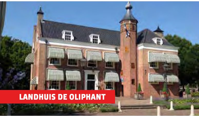
LANDHUIS DE OLIPHANT