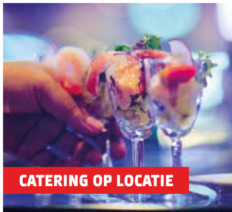
CATERING OP LOCATIE