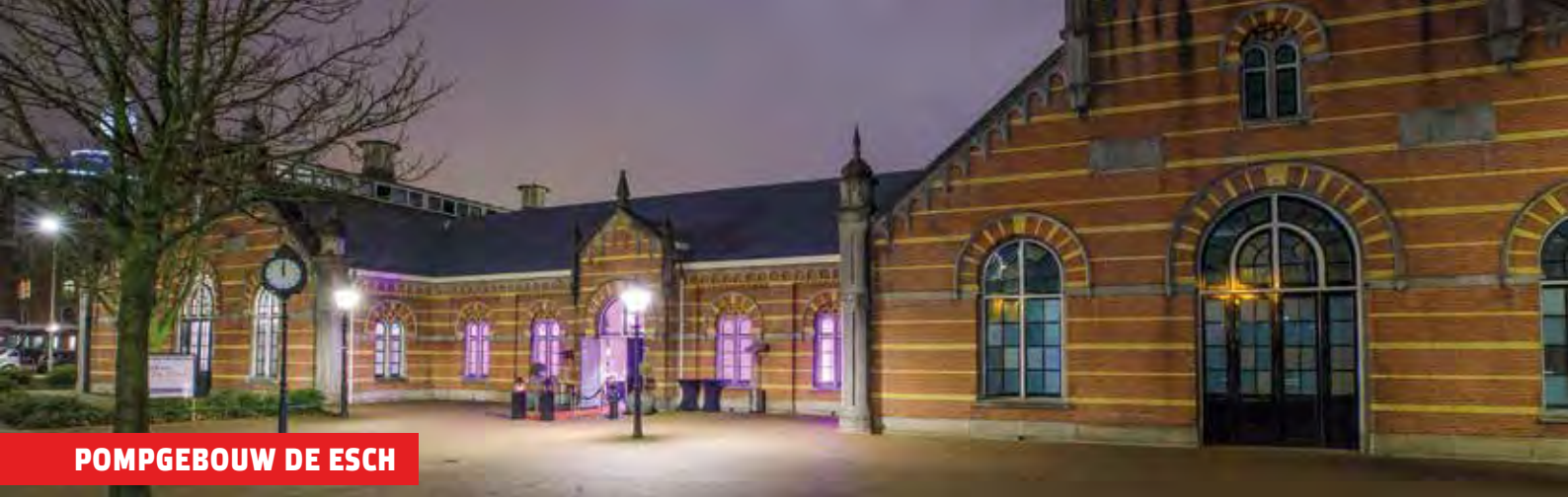
POMPGEBOUW DE ESCH