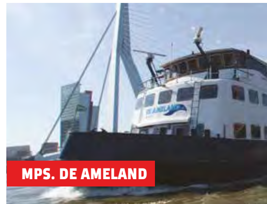
MPS. DE AMELAND